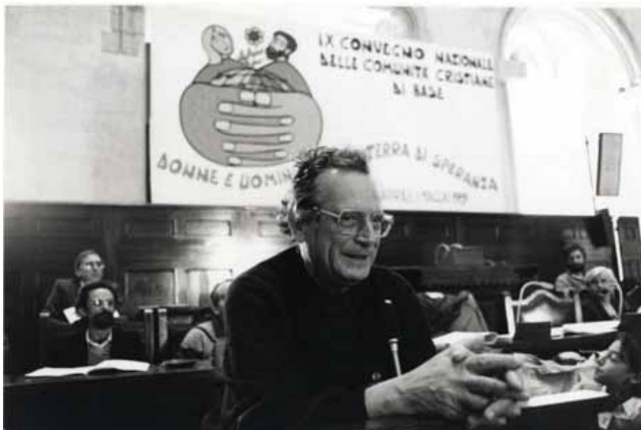
Un'immagine di dom Franzoni

Un cattolico marginale. Addio a Giovanni Franzoni. Da abate della basilica di san Paolo fuori le Mura inverò la chiesa conciliare. Pacifista, dalla parte degli ultimi e dei lavoratori, nel '76 fu espulso dal clero