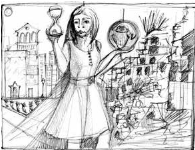
Il tempo dell'attesa, Catti Cifatte