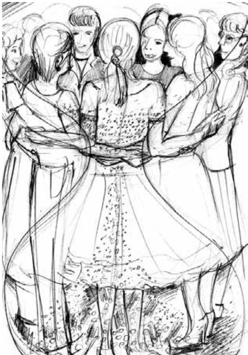
La relazione fra donne componente del tempo, Catti Cifatte